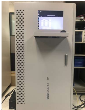
그림 2. ESS 시스템 구성 사진

배터리 용량은 10.256kWh 및 PCS 용량은 5kWh로 가정이나 사무실에 사용할 수 있는 ESS 시스템을 구성하였다. 그밖에 운용 중 발생할 수 있는 갑작스러운 문제발생에 대비하여 보조 전원인 UPS를 추가하였다. BMS, PCS와 EMS 사이에 RS-485통신과 Ethernet 통신을 2가지를 연결하여 기존 ESS 시스템의 한 가지 방식으로 하는 통신 구조보다 더욱 안정적인 데이터 송·수신 및 정확한 측정값을 전달 할 수 있게 구성하였다. 그리고 BMS 및 PCS에 연결되어 있는 통신에 문제가 생길 경우 자동으로 차단할 수 있는 Relay 제어 프로그램을 추가하였습니다.